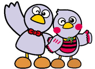
埼玉県マスコット コバトン&さいたまっち

※ 説明会の申込方法や内容については、各高校のホームページを確認してください。 また、上記、学校説明会の日程一覧のページから高校名をクリックすると、各高校のホームページを見ることができます。